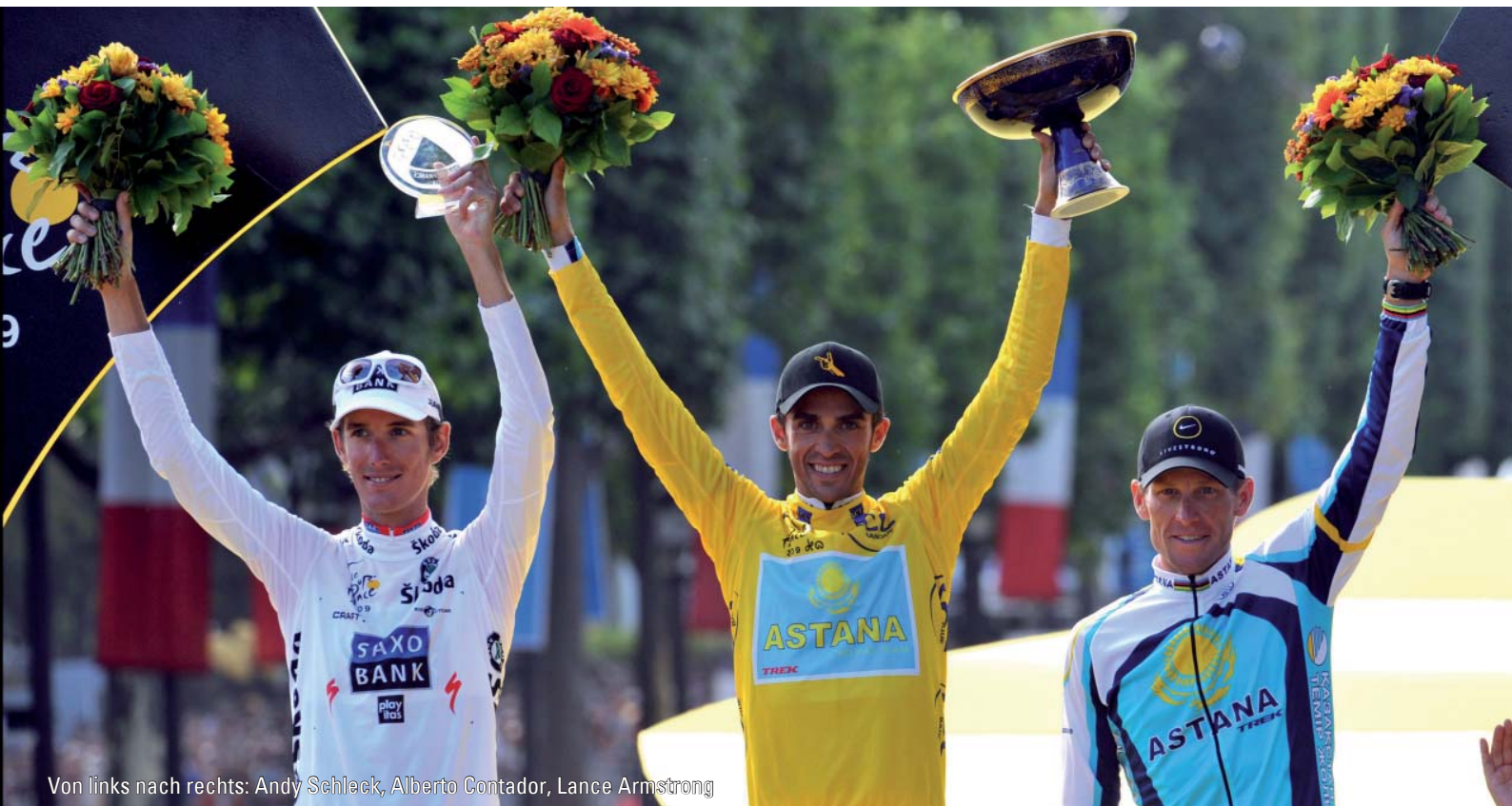
Von links nach rechts: Andy Schleck, Alberto Contador, Lance Armstrong

SRAM Red belegt die ersten drei Plätze bei der Tour de France 2009