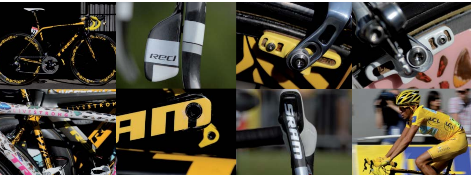
SRAM Red Maßanfertigungen bei der Tour de France 2009