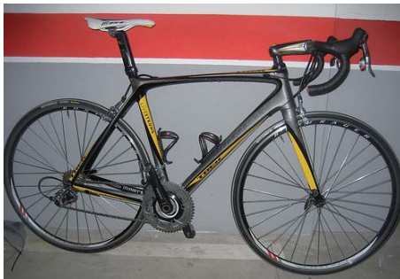
Trek Livestrong mit SRAM Ausstattung

Lance Armstrong hat mit seinem Profi Radsport-Comeback die Fahrradwelt aufgemischt. Wo Lance auftaucht ist das Medieninteresse riesengroß. Beim Astana Trainingscamp auf Teneriffa wusste man, dass etwas Besonderes passiert: von den Paparazzi vor dem Hotel bis zu den TV-Crews, die alles aufzeichneten.