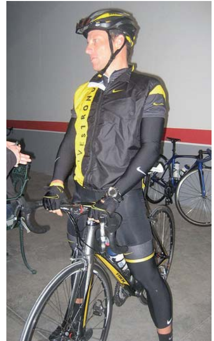
Lance Armstrong liebt sein neues SRAM Outfit

Das Team Astana und Lance Armstrong beginnen die Saison in Australien bei der Tour Down Under.