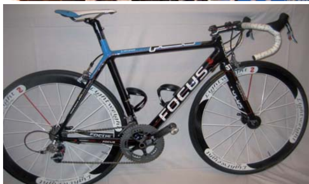
Team Milram und ihre neue Gewinnermaschine!